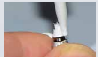
Applikation von Multilink Hybrid Abutment auf die Titanbasis