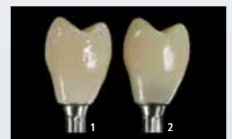
Hybrid-Abutment-Krone verklebt mit Multilink Hybrid Abutment HO 0 (1) und einem Befestigungsmaterial normaler Opazität (2)